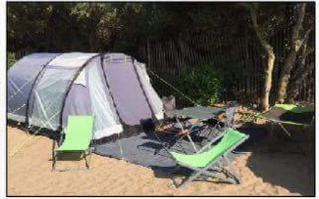
Livré, installé à votre arrivée... Le concept séduit à tel point que des pré-réervations seront possibles en ligne dès le mois de septembre.

« Notre clientèle va de l'étudiant au retraité en passant par les familles et les célibataires soit tous ceux qui souhaitent passer des vacances en camping. Notre principe est de vous livrer le jour de votre arrivée