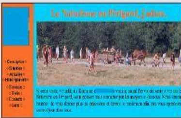
Le site Internet du domaine propose une visite virtuelle du camping qui attire de nombreux touristes, en toute discrétion.

À bien y rechercher parmi les destinations qui proposent une offre de ce type, on se rend vite compte que le naturisme à la cote et ce dans tous les sens du terme: premièrement des millions de nuitées sont chaque année primées d'assaut en Aquitaine qui est sur la deuxième marche du podium des destinations naturistes de France. Le nombre de ce type de campings a été multiplié par 6 entre le début des années 70 et aujourd'hui. « La cote » en encore pour une offre qui est en règle générale est essentiellement balnéaire. Mais contrairement à d'autres destinations, l'Aquitaine dispose d'endroits réservés aux naturistes aussi bien sur le littoral qu'à la campagne. Et cela se sait peu mais il existe un camping naturiste à quelques encablures de Libourne, très précieusement Saint-Géraud-de-Corps à Montpon. Sur leur site Internet les propriétaires invitent les campeurs, d'avril