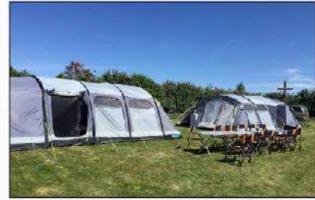
Pour les mariages, et autres événements, les grandes tentes gonflables offrent une solution pour que tout le monde reste sur place.

les campings ou chez des particuliers. « Récemment nous avons livré du matériel pour une cliente qui partait camper chez sa tante et une autre sur le terrain d'une dame qui faisait chambre d'hôte, dans un endroit magique », poursuit Yannès. Une autre livraison vendredi dans un camping pour des vacanciers