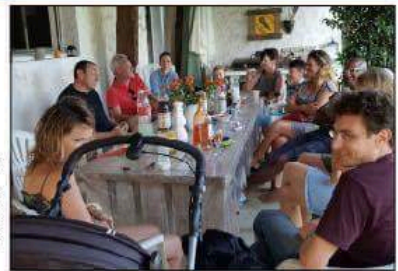
Around d'une table on peut se retrouver ou pas, selon l'envie. Campeurs et propriétaires disent aimer ces moments d'échange et de partage.

Les différentes plateformes de camping chez l'habitant fonctionnent toutes sur le même principe. Le propriétaire crée gratuitement un compte, diffuse des photos de son jardin et liste les services qu'il propose. Type de matériel admis, tente, caravane ou camping-car, sanitaires chez l'habitant ou indépendants, électricité, animaux admis ou pas, accès à une piscine. Sans oublier bien évidemment le tarif et le nombre de campeurs acceptés sur le terrain. Quand le vacancier se connecte, il n'a plus qu'à choisir en fonction de ses envies. Certains sites répertorient même des adresses à l'étranger, d'autres proposent des applications à télécharger sur smartphone géolocalisant les offres disponibles à proximité. En France, le camping chez l'habitant est réglementé. L'activité peut être librement pratiquée, hors de l'emprise des routes et voies publiques, avec l'accord de celui qui a la jouissance du sol. La délivrance d'un permis d'aménager n'est pas obligatoire lorsque la capacité d'accueil est en deçà de 20 personnes ou de six hébergements de loisirs constitués de tentes, de caravanes ou autres. Les revenus générés par cette activité même occasionnelle sont considérés comme des revenus fonciers au même titre que la location d'un logement.